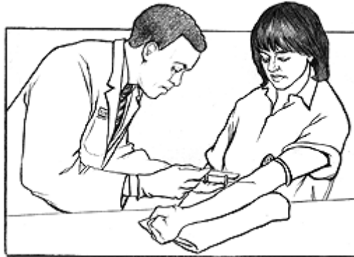
El médico le extraerá sangre para la prueba de la hepatitis C.

La biopsia es una prueba sencilla. El médico extrae un pedazo muy pequeño de su hígado por medio de una aguja. Ese fragmento de hígado se estudia en busca de signos de hepatitis C y daño del hígado.