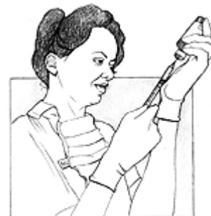
La hepatitis C se trata con inyecciones.

Si padece de hepatitis C durante muchos años, usted podría necesitar cirugía. Con el transcurso del tiempo, la hepatitis C puede hacer que su hígado deje de funcionar. Si eso sucede, usted necesitará un hígado nuevo. La operación se llama trasplante de hígado. Consiste en quitar el hígado propio lesionado y sustituirlo con otro hígado sano de un donante.